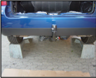
Fahrzeug mit AHK