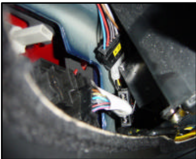
Anschluss des E-Satzes an den Rückleuchten