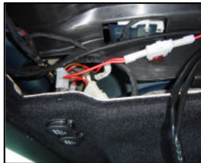
Anschluss des E-Satzes, Stromversorgung vom Modul