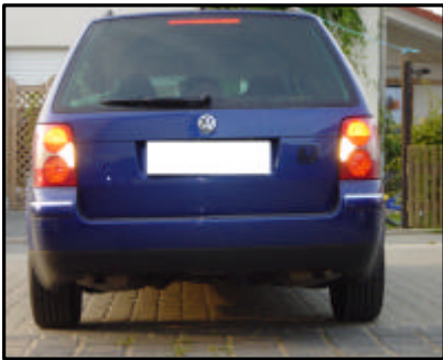
Fahrzeug ohne Kugelkopf