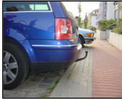
AHK von der Seite