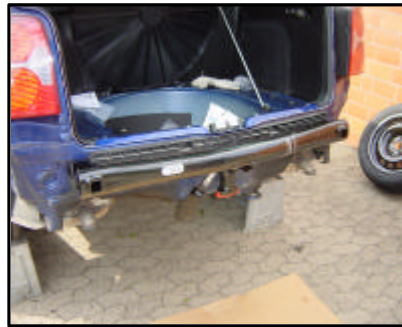
Anbau der AHK