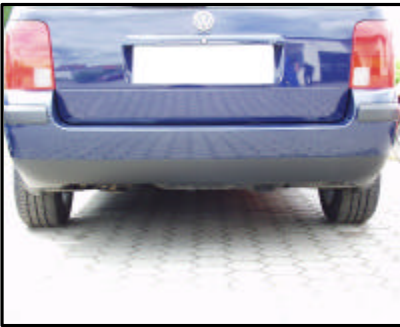
Fahrzeug ohne Kugelkopf