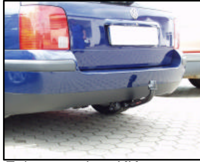
Fahrzeug ohne KK