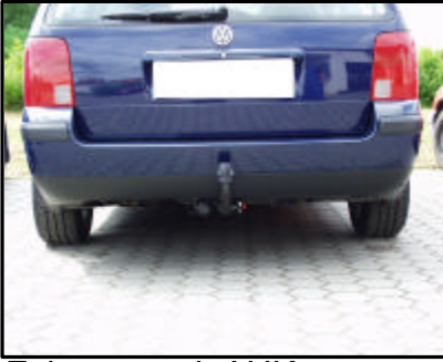
Fahrzeug mit AHK