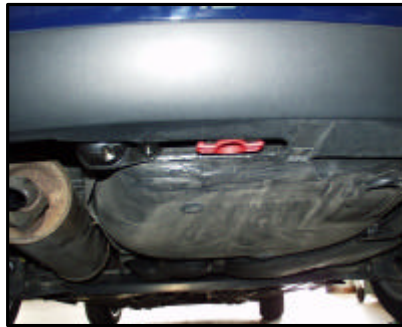
Fahrzeug von schräg unten