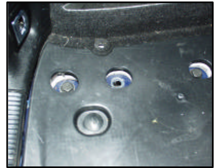
Befestigungspunkte im Kofferraum