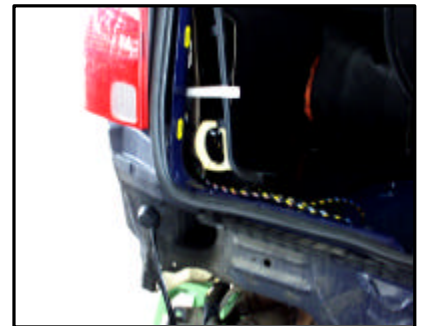
Verlegung des E-Satzes

Beiträge zur Erweiterung bzw. Vervollständigung unserer Informations- bzw. Bilddatenbank honorieren wir mit bis zu 50 Euro. Sollten Sie Interesse haben, setzen Sie sich bitte per E-Mail mit Herrn Auert unter technik@kupplung.de in Verbindung.