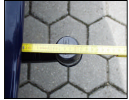
Abstand vom KK zum Stossfänger