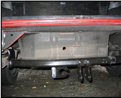
Anbau der AHK