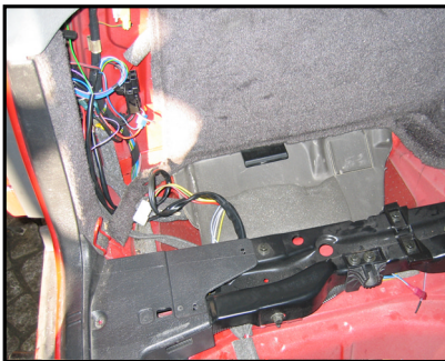
Anschluss des E-Satzes NSL