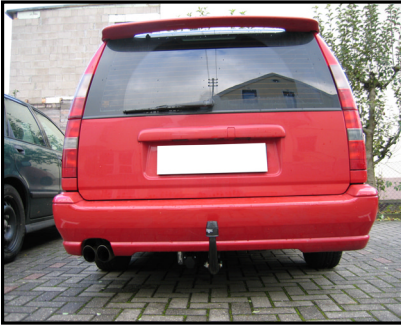
Fahrzeug mit AHK