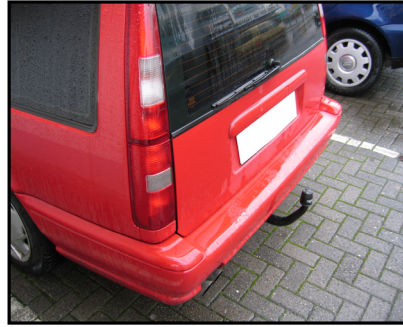
AHK von der Seite