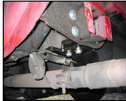
Anbau der AHK