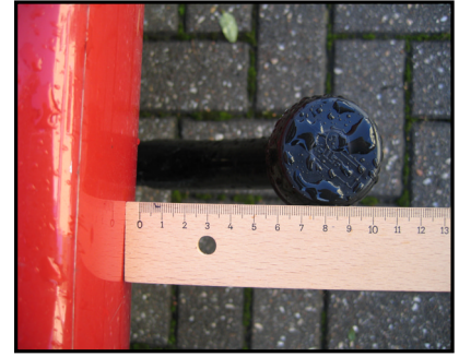
Abstand vom KK zur Stoßstange