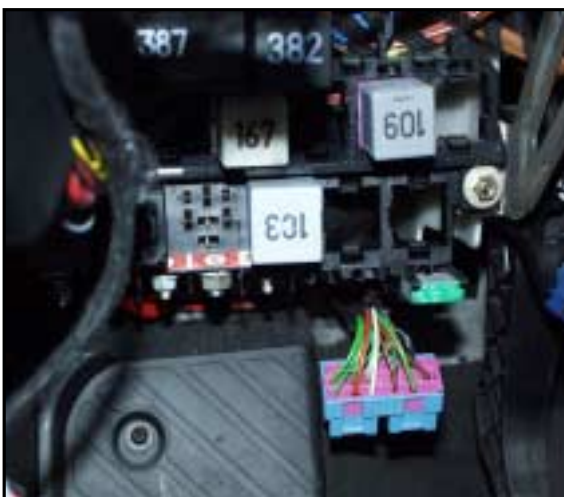
entfernter Stecksocket aus dem Träger