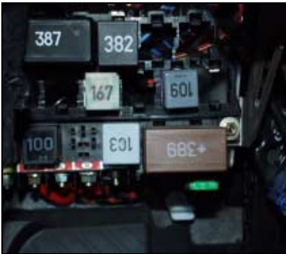
Check - Kontrollrelais *389

Dargestellte Abbildungen sind Fotomaterial, welches von uns fotografiert oder von Kunden zur Verfügung gestellt wurde. Sollte die Qualität bzw. die Darstellung nicht optimal sein, bitten wir um Nachsicht.