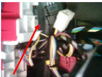
Montage Stecker linke Rückleuchte