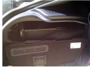
Demontage linke Verkleidung