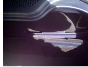
Demontage rechte Verkleidung