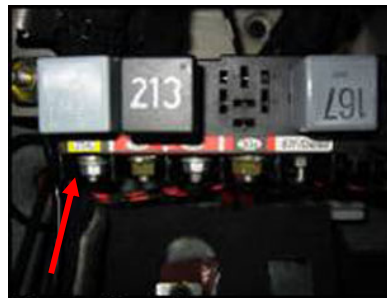
Montage Stromvers. Modul