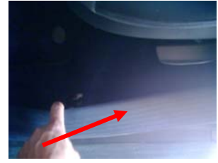
Demontage Schwellerverkl. vorn links