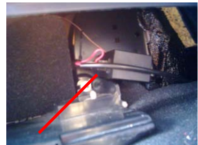
Montage Stecker und Modul