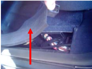
Demontage Schwellerverkl. hinten rechts