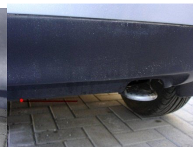
Torx 30 Schraube lösen links