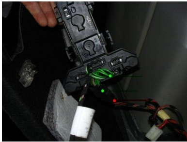
E-Satz rechts und links mit Rücklicht verbinden