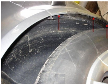
Torx 20 Schraube lösen 3mal