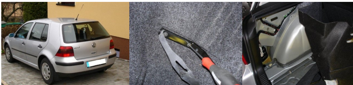
Fahrzeug vor dem Einbau