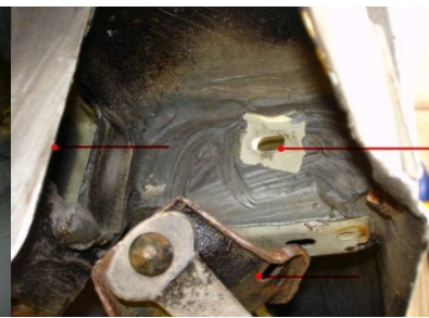
Montagepunkte freilegen und Auspuff halter demontieren