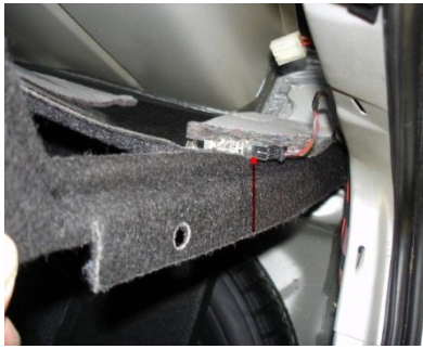
Steckverbinder Kofferraum licht lösen