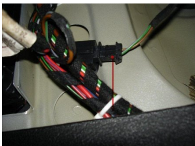
Steckverbinder für Kennzeichenleuchte