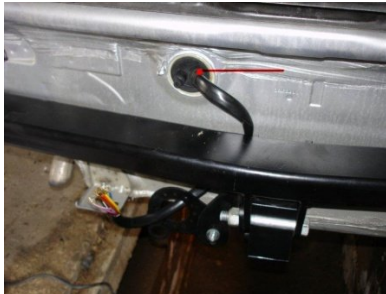
Durchführung E-Satz Kofferraum