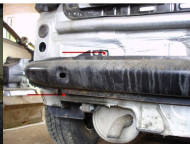
Schrauben M10 von Strebe lösen