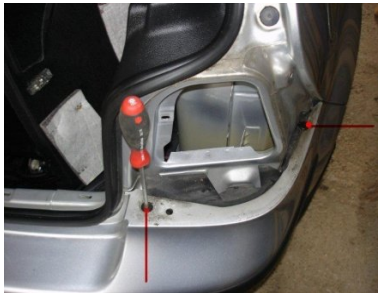
Torx 30 Schraube lösen