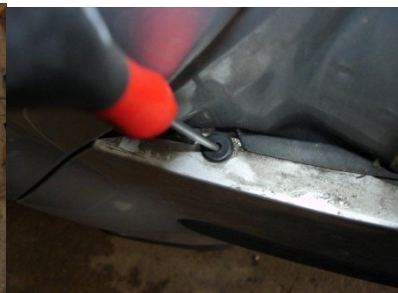
Plaste Niete ausstoßen