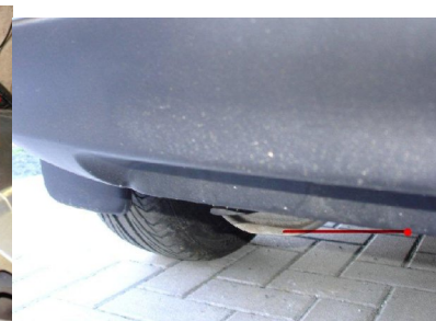
Torx 30 Sraube lösen rechts