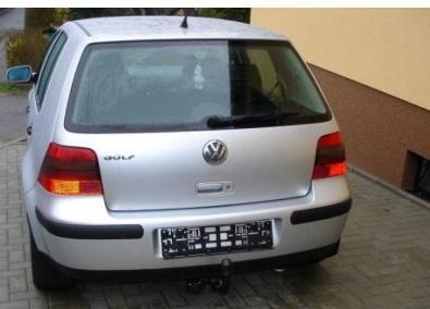
Fahrzeug von hinten mit Kugelkopf