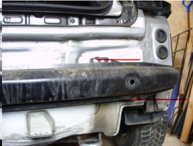
Schrauben M10 von Strebe lösen