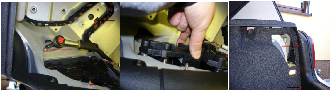
3x M8 Schrauben für Rücklicht