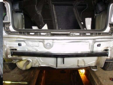
Grundträger von hinten