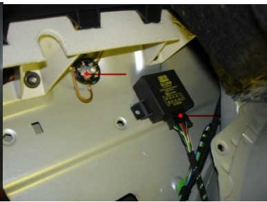
Massekabel aufschrauben Relais anstecken und befestigen