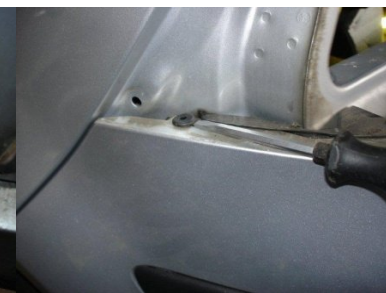
Niete mit Schraubenzieher lösen