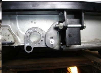
Montage Anhängerkupplung mit ab klappbarer Steckdose