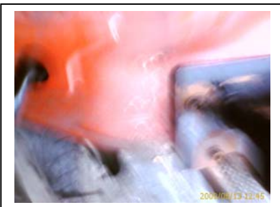
Kabeldurchführung links mit Gummitülle