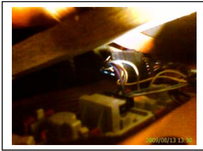
Anschluss links Modulbefestigung /Masse