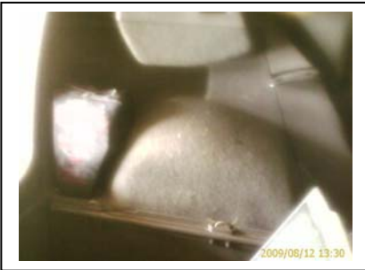
Linke Verkleidung Stoßstangenverkleidung