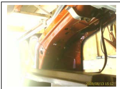
Verkleidung Rückblech Montierte Steckdose