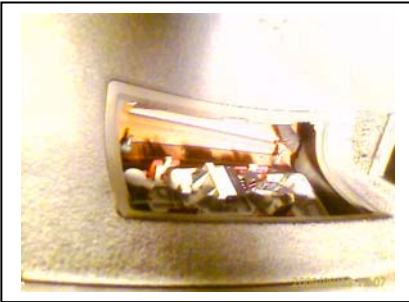
Rücklicht links Zusatztank Rapsöl