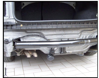
Fahrzeug ohne Stoßstange