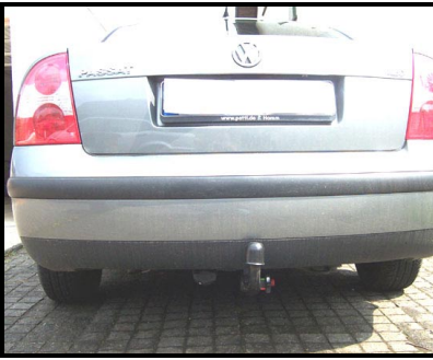
Fahrzeug mit AHK