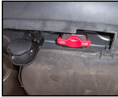
Fahrzeug ohne KK