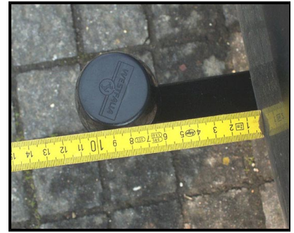
Abstand vom KK zur Stoßstange