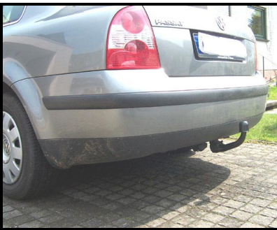
Fahrzeug mit KK