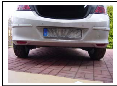
Fahrzeug von hinten mit abgenommener Kupplung