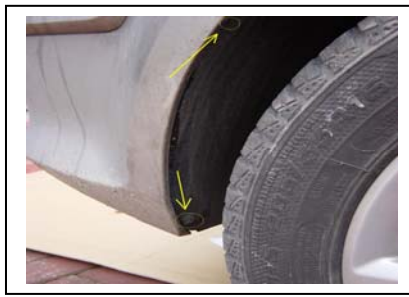
Demontage Stoßfänger Rechts 2 Schrauben