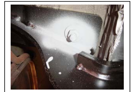
Kupplung Links montieren