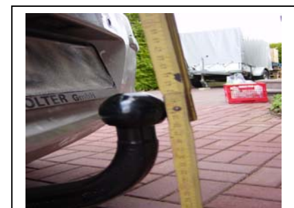
Kupplung von der Seite 400 mm