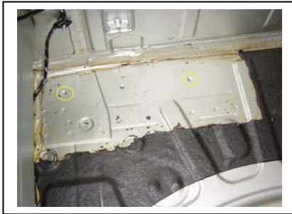
Löcher 20 mm Bohren