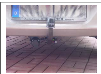
Fahrzeug mit montierter Kupplung und Steckdose