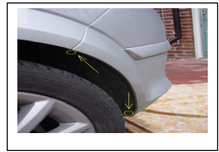
Demontage Stoßfänger Links 2 Schrauben