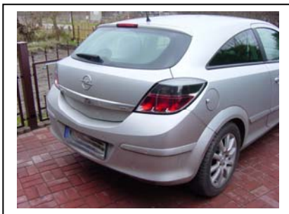
Fahrzeug vor dem Einbau