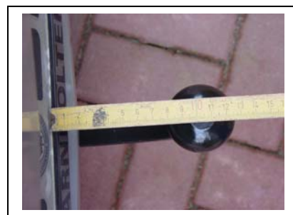
Kupplung von oben 100 mm