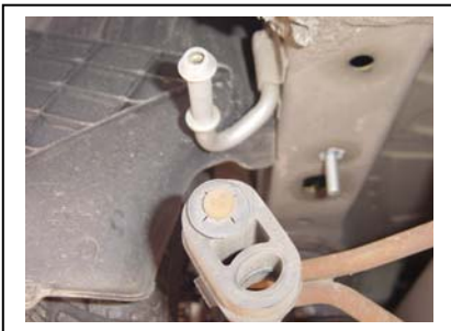
Endschalldämpfer Links und Rechts aushängen