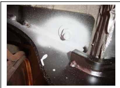
Kupplung Rechts montieren Schrauben mit Zink gegen Rost besprühen