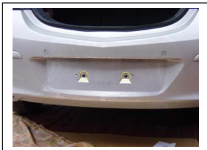
Demontage Stoßfänger Mitte 2 Schrauben