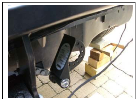
Elektrokupplungshalter montiert (10-er)