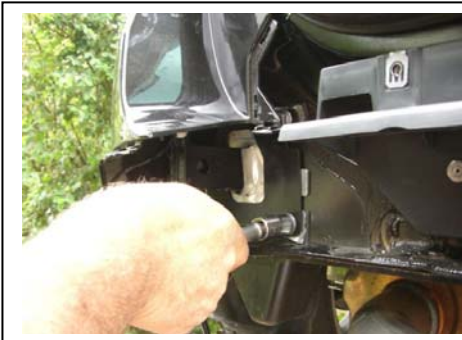
Befestigungseisen in Längsträger eingeführt, Abdeckung eingeschnitten und wieder verschraubt. (13-er)