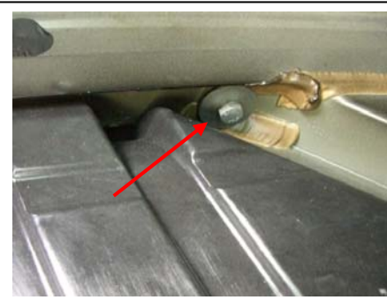
Montagepunkt (17-er) linker Längsträger Zugang vom Reserveradplatz