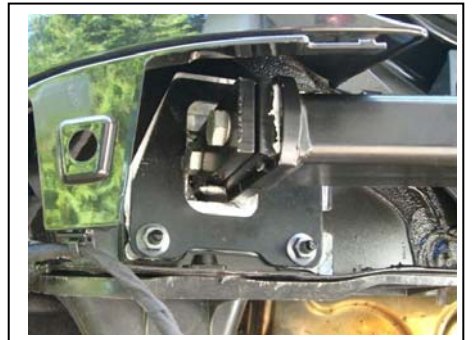
Verschraubung AHK-Träger mit Befestigungseisen links (17-er und 19-er) z.T. nur mit Schlüssel möglich