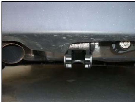
Stoßfängerverkleidung wieder montiert und AHK abgenommen