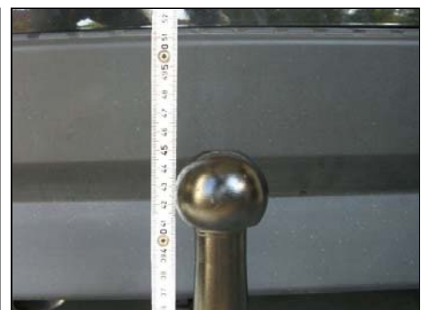
Kugelkopfabstand vom Boden: 45cm