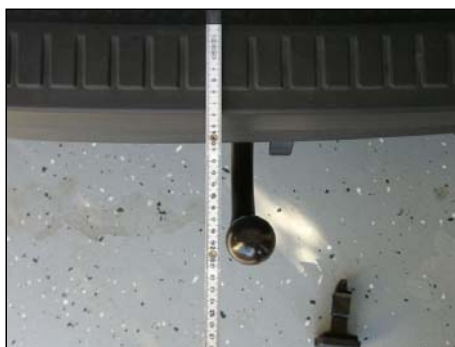
Kugelkopfabstand zur Stoßfängerverkleidung: 11cm