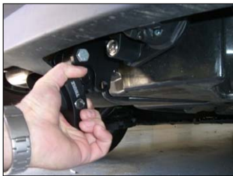
Verriegelung um 90° drehen