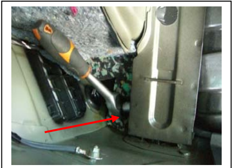
Montagepunkt linker Längsträger Zugang vom linken Hohlraum (daher Seitenverkleidungsausbau)