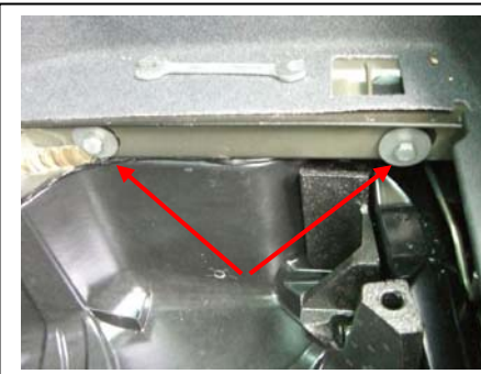
Montagepunkte (17-er) rechter Längsträger, für beide Zugang vom Reserveradplatz