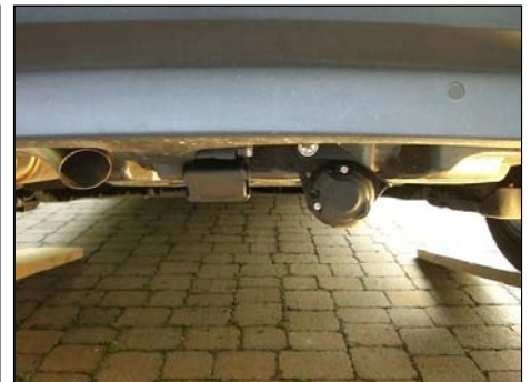
Abdeckung gesteckt und Elektrodose nach unten geklappt