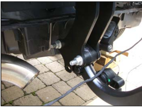
AHK am Träger festgeschraubt (Schlüsselgröße 18 und 19)