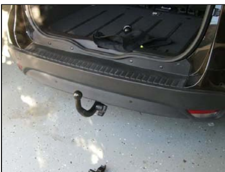
Von schräg oben