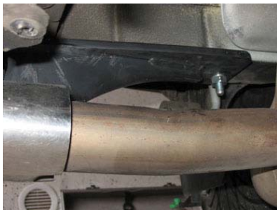
Anbau AHK rechts außen