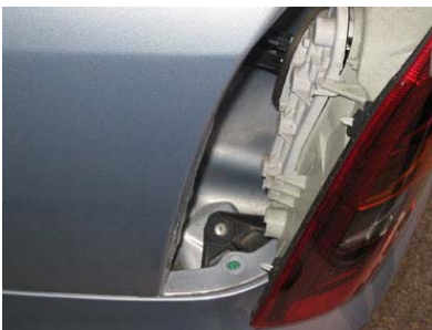
Ausbau Rücklicht links