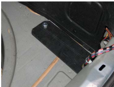
Einbau Platte rechts