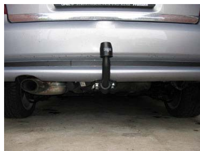
Fahrzeug von hinten