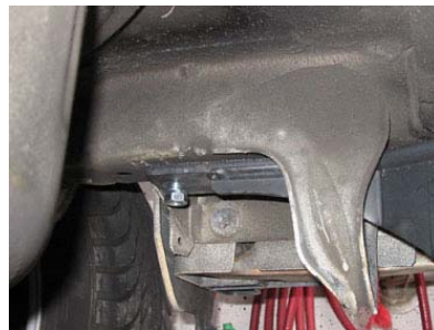
Anbau AHK links außen