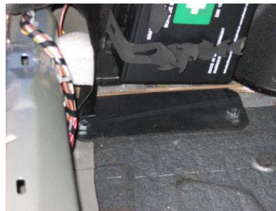
Einbau Platte links