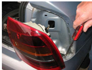
Ausbau Rücklicht rechts