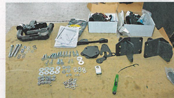
Der Einbausatz für die Hybrid-C-Klasse, die Fahrzeugelektronik erfordert Spezialwissen. Knapp 800 Euro kostet die Nachrüstung.

Bei Eingriffen in das Gesamtsystem kann das knifflig werden. Wird eine neue Komponente dazugebaut, müssen die Steuergeräte das wissen und sozusagen lernen, damit umzugehen. Rameder als Spezialist für Nachrüstkupplungen hat dafür ein Online-System entwickelt. Der Monteur vor Ort verbindet dafür das Auto per Interface mit einem Arbeitsplatz in der Rame-