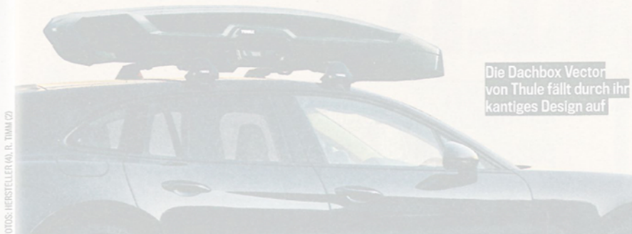
Die Dachbox Vector von Thule fällt durch ihr kantiges Design auf

Eine Dachbox soll viel wegstecken können, leicht zugänglich und windschnittig sein. Jetzt gibt es eine neue Box von Thule, die auch noch durch ihr Design auffällt. Die Vector ist nicht so rundgelutscht wie andere Gepäckfächer fürs Dach, sondern sie hat Ecken und Kanten. Eine weiße Innenseite und LEDs im Deckel helfen beim Be- und Entladen bei Nacht. Das Öffnungssystem macht das Beladen von beiden Seiten möglich. Verriegelungs- und Öffnungsfunktion sind getrennt und zeigen an, wann der Deckel sicher verschlossen ist. Die Box lässt sich laut Hersteller einfach und sicher auf dem Dach montieren. Eine Filzbeschichtung schützt die Ladung. Preis: rund 1500 Euro.