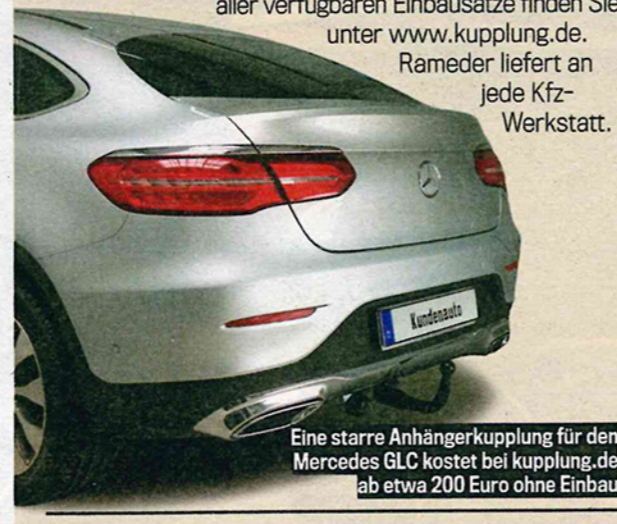
Eine starre Anhängerkupplung für den Mercedes GLC kostet bei Kupplung.de ab etwa 200 Euro ohne Einbau

Ob für Wohnwagen, Pferde- oder Bootsanhänger – ein SUV dient oft als Zugmaschine. Wer beim Autokauf die Anhängerkupplung nicht mitbestellt hat, kann sie auch nachträglich einbauen lassen: Die Firma Rameder bietet Nachrüstsätze für viele SUV-Modelle und Geländewagen an, vom Land Rover Defender über Toyota Land Cruiser und VW T-Roc bis zum Mercedes GLC. Eine Liste aller verfügbaren Einbausätze finden Sie unter www.kupplung.de . Rameder liefert an jede Kfz-Werkstatt.