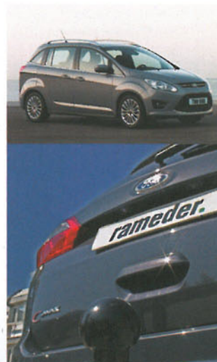
Beim Ford C-Max sorgen die Rameder-Kupplungen auch dafür, dass die Rückfahrwarnung im Anhängerbetrieb automatisch deaktiviert wird