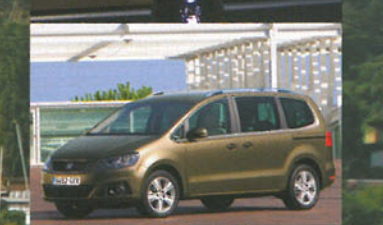
Beim Sharan spart man mit Anhängerkupplungen von Rameder rund 200 Euro gegenüber dem Originalzubehör