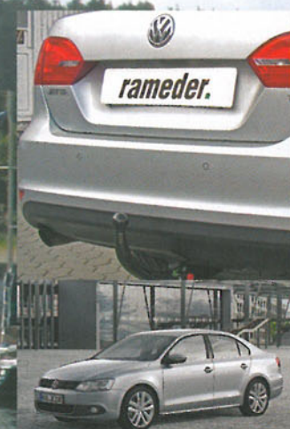
Der Jetta schleppt bis zu 1.800 Kilogramm schwere Lasten