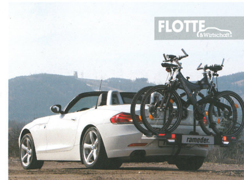
Bei BMW sucht man eine Anhängerkupplung für den Z4 vergeblich. Rameder hat sie im Programm!