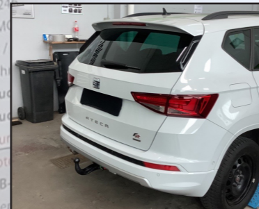
Seat Ateca SUV Typ KH7