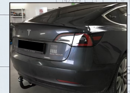
Tesla Model 3

LVP: 537,82 € 37% RABATT Art-Nr.: 173903 neu 339,00 €*