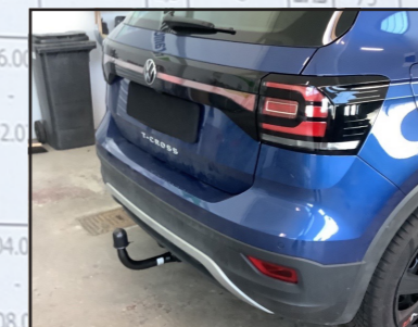
VW T-Cross SUV Typ C11

LVP: 558,82 € 37% RABATT Art-Nr.: 187355 neu 352,00 €*