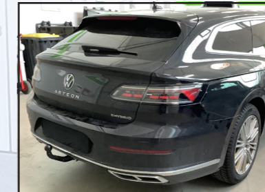
VW Arteon Shooting Brake Typ 3H9

LVP: 516,81 € 37% RABATT Art-Nr.: 187530 neu 326,00 €*