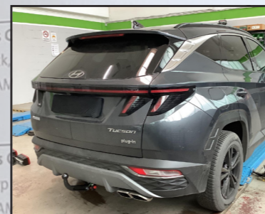
Hyundai Tucson SUV Typ NX4E

LVP: 372,27 € 24% RABATT Art-Nr.: 128530 neu 280,00 €*