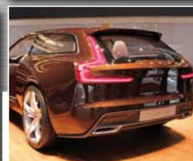
Volvo Concept Estate ist der Ausblick der Schweden auf das künftige Marken-Design – und vermutlich den neuen V90.