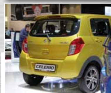
Suzuki Celerio der Nachfolger des Alto wird um 10 cm auf 3,60 m gekürzt und hat dennoch ein Kofferraumvolumen von 254L.