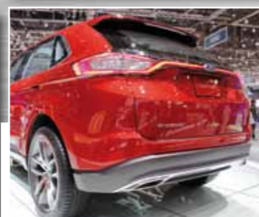
Ford Edge soll seinen amerikanischen Erfolg in Europa fortsetzen und tritt hier gegen den VW Touareg an.