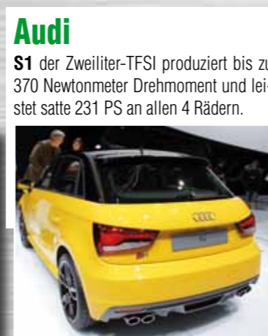
Audi S1 der Zweiliter-TFSI produziert bis zu 370 Newtonmeter Drehmoment und leistet satte 231 PS an allen 4 Rädern.