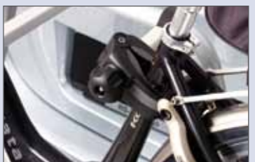
Befestigung des Fahrrades