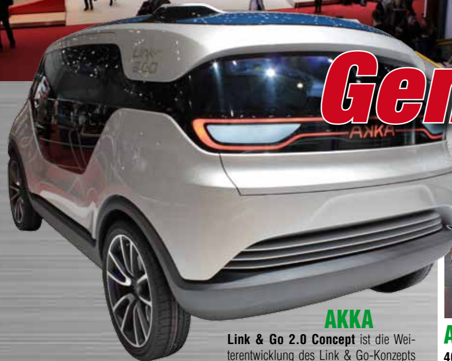
AKKA Link & Go 2.0 Concept ist die Weiterentwicklung des Link & Go-Konzepts und kombiniert eine Elektroantrieb mit autonomen Fahren.