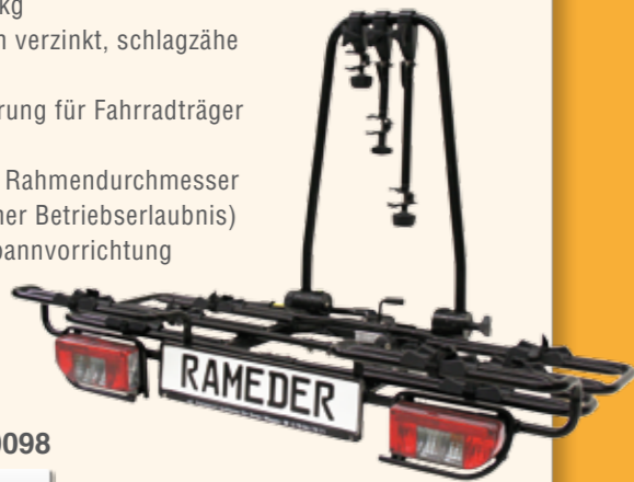
Abbildung mit Erweiterungen