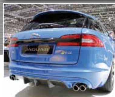
Jaguar XFR-S Sportbrake in 4,8 Sek. sprintet Papas Liebling auf 100. Leider wird bei 300 km/h elektronisch abgeregelt.