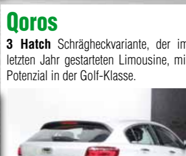
Qoros 3 Hatch Schrägheckvariante, der im letzten Jahr gestarteten Limousine, mit Potenzial in der Golf-Klasse.