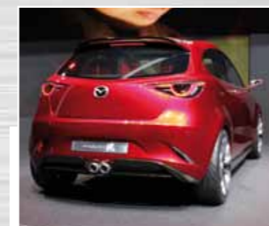
Mazda Hazumi heißt übersetzt „an- oder abspringen“. So könnte der Sprung in die nächste Generation des Mazda2 aussehen.