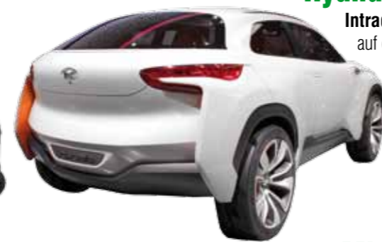
Hyundai Intrado Concept gibt einen Ausblick auf das zukünftige Hyundai-Design. Der Wasserstoff-Brennzellen Motor soll eine Reichweite von 600 km haben.