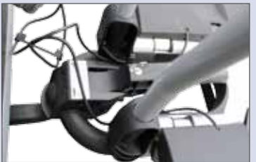
Montage auf der Anhängerkupplung