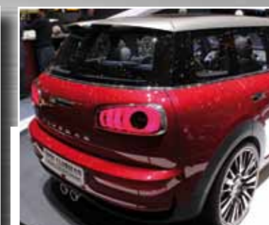
Mini Clubman Concept 26 cm in der Länge und knapp 17 cm in der Breite wächst der aktuelle Clubman auf Golf-Niveau.