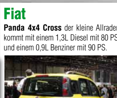
Fiat Panda 4x4 Cross der kleine Allrader kommt mit einem 1,3L Diesel mit 80 PS und einem 0,9L Benziner mit 90 PS.