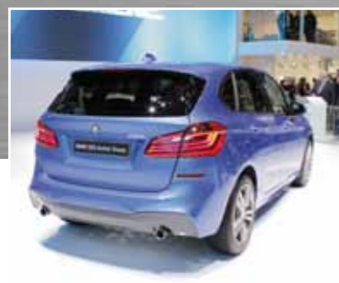
BMW 2er Active Tourer ist der erste Van der Bayern und soll gegen Mercedes B-Klasse und VW Touran antreten.