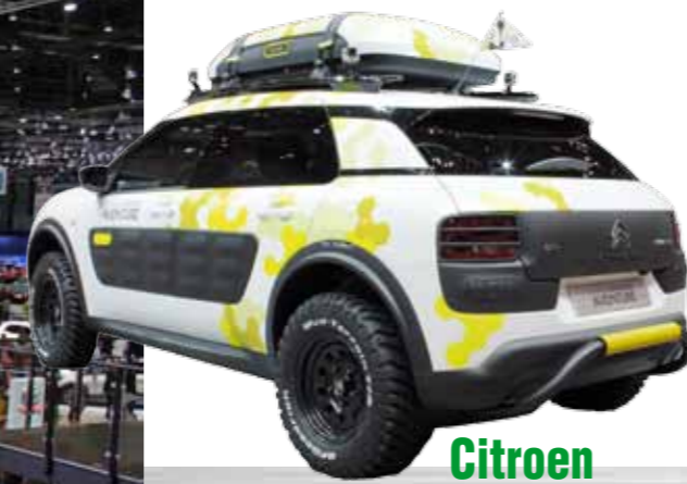
Citroen C4 Cactus Adventure ist der geländetaugliche Ableger des C4 Cactus. Ein höhergelegtes Fahrwerk, robuste Stahlfelgen, grobstollige Reifen, eine Dachbox und vieles mehr sind die wesentlichen Unterscheidungsmerkmale.