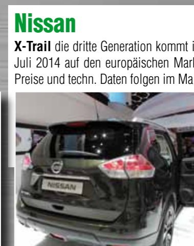
Nissan X-Trail die dritte Generation kommt im Juli 2014 auf den europäischen Markt. Preise und techn. Daten folgen im Mai.