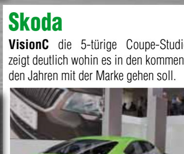
Skoda VisionC die 5-türige Coupe-Studie zeigt deutlich wohin es in den kommenden Jahren mit der Marke gehen soll.