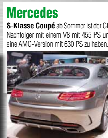
Mercedes S-Klasse Coupé ab Sommer ist der CL-Nachfolger mit einem V8 mit 455 PS und eine AMG-Version mit 630 PS zu haben.