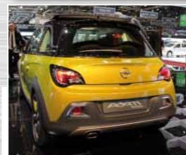
Opel Adam Rocks der 3,74 Meter lange Mini-Crossover kommt ab August 2014 in Serienproduktion aus Eisenach.