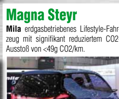
Magna Steyr Mila erdgasbetriebenes Lifestyle-Fahrzeug mit signifikant reduziertem CO2-Ausstoß von <49g CO2/km.