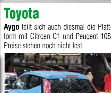
Toyota Aygo teilt sich auch diesmal die Plattform mit Citroen C1 und Peugeot 108. Preise stehen noch nicht fest.