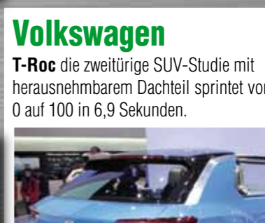
Volkswagen T-Roc die zweitürige SUV-Studie mit herausnehmbarem Dacheil sprintet von 0 auf 100 in 6,9 Sekunden.