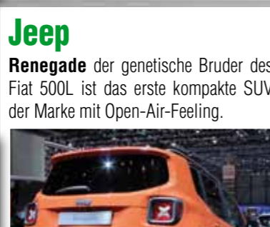
Jeep Renegade der genetische Bruder des Fiat 500L ist das erste kompakte SUV der Marke mit Open-Air-Feeling.