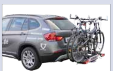
Einsatz am Fahrzeug