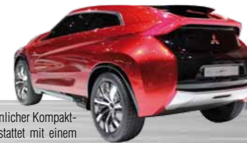
Mitsubishi XR-PHEV Concept ist ein coupéähnlicher Kompakt-SUV mit sportlichen Zügen. Ausgestattet mit einem Plug-In-Hybridantrieb, jedoch nur mit Frontantrieb.