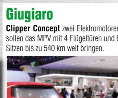
Giugiaro Clipper Concept zwei Elektromotoren sollen das MPV mit 4 Flügeltüren und 6 Sitzen bis zu 540 km weit bringen.