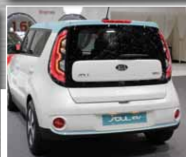
Kia Soul EV erstes E-Mobil aus Korea geht im Herbst 2014 gegen Leaf & Co ins Rennen. Akku-Leistung beträgt ca. 160 km.