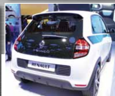
Renault Twingo die dritte Generation des Franzosen kommt mit Drei-Zylinder-Motor und Heckantrieb für unter 10.000 Euro.