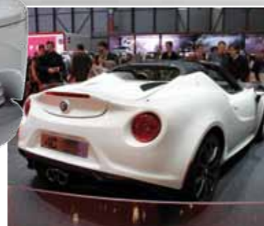
Alfa Romeo 4C Spider Concept der verstärkte Einsatz von Kohlefaser ist Grundlage des rassisten Sportlers mit Stoffverdeck.

Auch in diesem Jahr waren wir für Sie auf Fotosafari und präsentieren pünktlich zum Beginn des Autofrühlings, die aktuellen Heckansichten der neuesten Fahrzeugmodelle 2014.