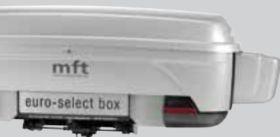
euro-select box mit Erweiterung (111157) 190 cm Breite und 326 Liter Stauraum

Die Wechseleinsätze mittel oder groß für die MFT euro-select box bieten die Möglichkeit, die Breite der Transportbox zu erweitern und den Stauraum zu erhöhen.