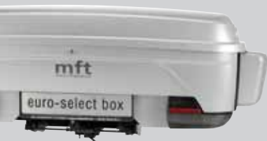
euro-select box mit Erweiterung (111156) 172 cm Breite und 312 Liter Stauraum