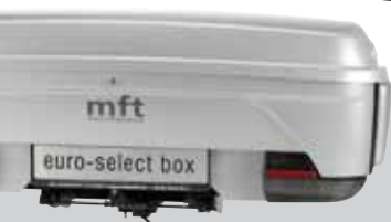
euro-select box (standard)