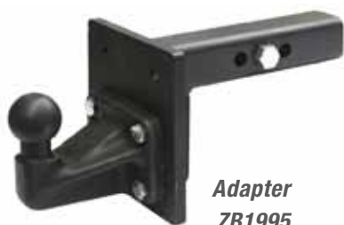
Adapter ZB1995 für 219,00€

Ja, z.B. im Falle von US-Importfahrzeugen, wie Dodge RAM usw., bieten wir in unserem Shop spezielle Adapter für bereits vorhandene Traversen an. Zum Einen bieten wir für das Tige-US-System einen Adapter für Fahrzeuge mit Rahmenabschlussquerträger und 50x50 mm-Aufnahme an, welcher sich zusätzlich noch um 180° drehen lässt (ZB1995 für 219,00€). Zum anderen haben wir ebenfalls noch einen Adapter für US-Jeeps mit 2-Loch-Flanschkuigel im Angebot (ZB5109 für 119,00€).