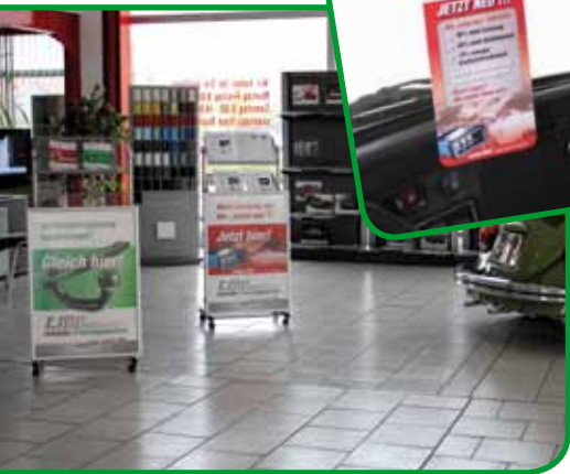
Die ersten Werbepakete sind schon unterwegs!