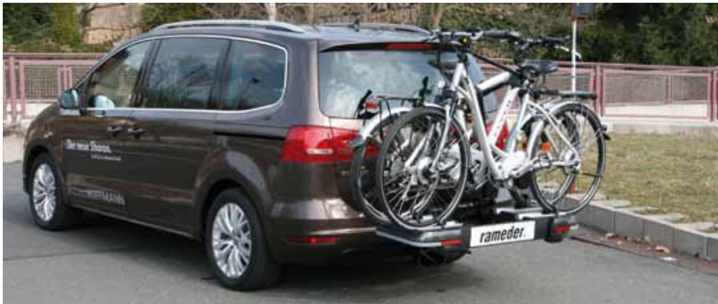
E-Bike Transport mit einem Euro Select XT

Elektrobikes, oder auch Pedelecs genannt, halten immer stärker Einzug in die deutsche Freizeitlandschaft. Doch wie transportieren, wenn diese mit an den Urlaubsort sollen? Sind bereits vorhandene Fahrradträger geeignet? Diese und weitere Fragen werden Ihre Kunden sicher häufiger stellen. Wir wollen Ihnen dabei helfen diese Fragen zu beantworten.