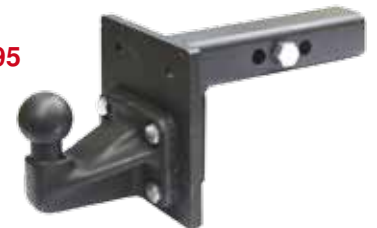
z.B. ZB1995 219,00 €

Alle Produkte und mehr Infos unter www.kupplung.de