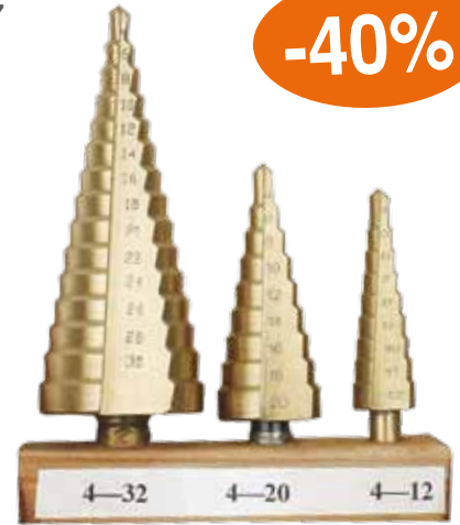
3-teilig, HSS-Titan beschichtet, Größen 4-32 mm, für stufenloses Bohren ohne Deformierung