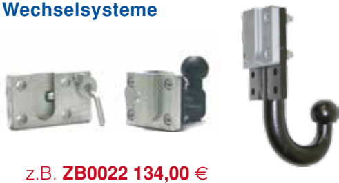
z.B. ZB0022 134,00 €

Mit einem Wechselsystem kann man mehrere Flanschkuugeln mit verschiedenen Höhen, eine Maulkupplung oder andere Speziallösungen nutzen, ohne ständig alle Verschraubungen lösen zu müssen . Dieses besteht aus einer Grundplatte, welche fest mit dem Anhängelock verschraubt ist und einer oder mehreren Wechselplatten. Der Vorteil besteht darin, dass mit wenigen Handgriffen verschiedene Kuppelungssysteme sofort einsatzbereit sind.