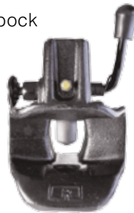
z.B. ZB2542 79,00 €

Durch einen Bolzenkombikugelkopf ist es möglich, mit einem 2-Loch Anhängelock, mit Lochmaß 90 mm einen Anhänger mit Ringöse zu ziehen.