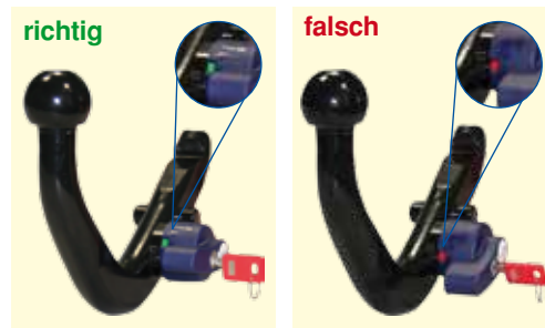
Federn sind entspannt