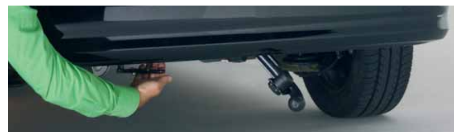
Ausklappen der Anhängerkupplung