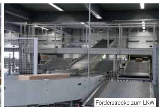
Förderstrecke zum LKW