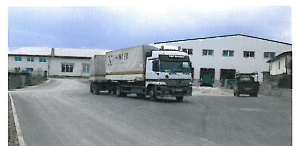
Und ab die Post zu Ihnen.