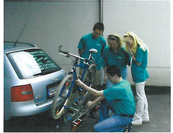
... auf internen und externen Schulungen.

So werden unsere Mitarbeiter der Beratung ständig geschult um Ihnen bei auftauchenden Fragen weiterhelfen zu können. Im Rahmen der Schulungen werden die Mitarbeiter nicht nur theoretisch sondern auch praktisch in Bedienung, Handhabung und Funktionsweisen der verschiedenen Produkte eingewiesen. Dies stellt sicher, dass jeder einzelne aus unserem Team ein kompetenter Ansprechpartner ist. Auch wenn's nur Fragen zur Verfügbarkeit und Lieferzeit bestimmter Artikel sind, wenden Sie sich an uns, wir werden Ihnen weiterhelfen.