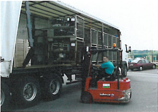
Tino Steinhorst beim Abladen einer Warenanlieferung.

Beginnend mit dem Abladen, meist mehrere hundert bis zu über 1000 Anhängerkupplungen je Anlieferung, dem bestätigen der Frachtpapiere nimmt eine AHK den Weg durch unser Lager. Schon beim Kontrollieren der Lieferscheine mit Position und Anzahl wird ein erster Qualitätscheck auf Komplettheit und äußere Beschädigungen durchgeführt.