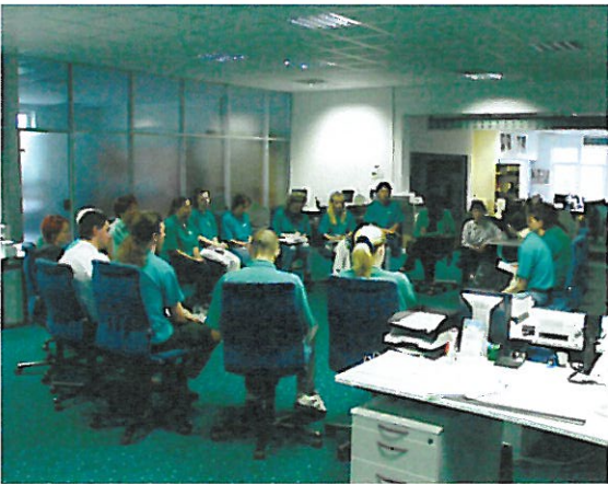
... bei der wöchentlichen Teambesprechung.

Unsere Mitarbeiter werden ständig geschult und stehen Ihnen als kompetenter Fachberater bei Vorauswahl, Bestellung und Einbau zur Seite. Das A und O in einer jeden Zusammenarbeit ist die Kompetenz, diese im Team zu festigen und auszubauen ist ein ständiger Bestandteil unserer Arbeit.