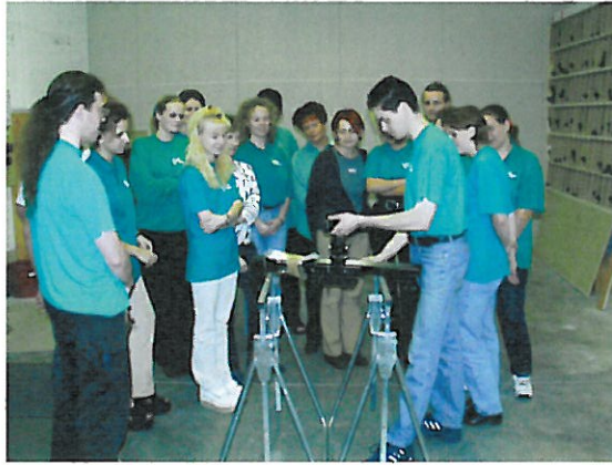
... bei Produkt-Neuvorstellungen.