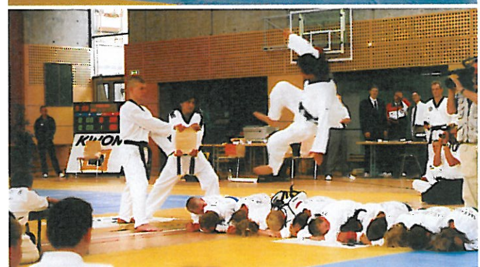
Eindrücke vom 5. Thüringer Schülerturnier.

Am Sonntag, dem 28. Mai 2000, fand das 5. Thüringer Taekwondo-Schülerturnier in der Sport- und Festhalle in Neustadt statt. Über 100 Kinder im Alter von 8 bis 13 Jahren nahmen am Wettkampftag, auf drei Wettkampfflächen, an diesem hervorragend organisierten und bestens ausgestatteten Turnier teil. Dieses optimale Umfeld für spannende Kämpfe sollte den Kindern das Flair großer Turniere vermitteln und sie auf internationale Wettkämpfe vorbereiten. Gekämpft wurde dann jeweils auf zwei Kampfflächen über je drei Runden (je 1,5 Minuten und 1 Minute Pause) um Plätze, Medallien und Pokale. Die ärztliche Betreuung, die laut Wettkampffregeln vorgeschrieben ist, lag in den Händen eines erfahrenen Arztes der Dank der überwiegend fairen